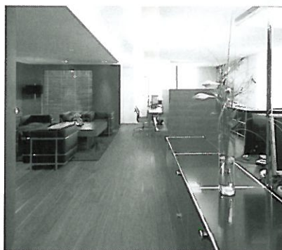
Fußböden: sowohl Handel als auch Eigenproduktion